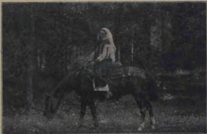
Port din Bilbor. (Com. Ciuc.)

Când sfârși Badea de mâncat, ea-i întinse ștergarul; apoi se repezi până la izvor, să-i aducă cofița cu apă proaspătă.