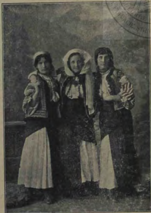
Port din Bilbor (Com. Ciuc.)

torul. — Mă duc, zic, să văd ce face nevasta cu casa . . . Așa? zice, și începe să mă sudue. Fă'nnapoi și-ți caută de treabă! . . . Și numa' ce s'alătură de mine și-mi șterge două palme . . . Atuncea, să vezi dumneata, am discălicat, l-am apucat pe băetan de după cap, l-am dat jos de pe cal, l-am pus înaintea mea, și l-am plecat până ce i s'au întins bine nădragi, colo, și i-am tras câteva până ce-a început să urle, cu capătul cel subțire dela ghioagă l-am bătut . . . Mi-a fost frică să-l bat mai rău . . . Vra să zică-i fecior de boer . . . Și iaca, mă chiamă, sara, boerul cel bătrân. — Cum a fost? zice. Iaca cum a fost, zic eu, și-i spun cum a fost . . . — Apoi îmi dă el doi lei bacșiș, și spune: Asta să n'o mai faci, da' nici cu palma n'are să te mai atingă nimeni, zice. Acū, eu i-am sărutat mâna, și m'am dus. Da' m'am mirat și eu de asta . . . Pe semne, unde-am creșcut la curte supt ochii lui . . . Da' el vra să zică ținea la mămuca, că eră harnică, și-i eră de folos la gospodărie . . . Boeru-i văduvoiu de multă vreme . . . Și eu i-s om cu credință: și asta o știe . . . La vaci a zis să mă duc, la vaci m'am dus . . .