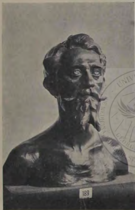
Oscar Späthe: Bustul arhitectului Clavel.

În sfârșit limba, și anume fără deosebire atât cea literară cât și cea populară, mai are un mijloc de îmbogățire, nu prin împrumut, ci prin întrebuințarea adeseori deprinsă a cuvintelor în alt înțeles decât cel, pe care singur îl avea cuvântul într'un timp oarecare din traiul său. Este un schimb de vorbe, cum ar zice Românul: gândești una și spui alta. Și acest mijloc de foarte multeori ești silit să-l întrebuințezi și