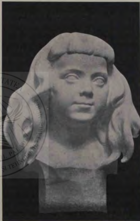
Oscar Späthe: »Jojița« (marmură).

ale lui în lumină strălucitoare a le pune, să nu vă leneviți! p. 21: »Să se poată sălășlui și acea bunătațe a inimei, care, ce e bun și frumos și adevăr, ori de unde ar fi, primește«. Și alte multe. Și într'un discurs mai recent se pot ceti propozițiuni ca acestea: »Ei se adună, pentruca prinos să aducă și hrană să dea« în loc de »să aducă prinos și să dea hrană...«. Sau: »În fața acesteia o mângăiere avem«. Și »aceia, cari... pildă vor lua«, unde nici motivul accentuării la locul întâi a cuvântului voit nu îndreptățește așezarea greșită a vorbelor.