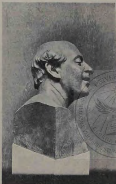
Oscar Späthe: Satir (bronz).

astfel le putem privi ca un nou spor în bogăția limbii noastre. Orice altfel de împrumut din limbi străine (străinisme, barbarisme) corcește, dărăpănează, urăște, strică o limbă, care are deja un trecut vechiu. Și îndeosebi trebuie să luptăm din toate puterile în contra neologismelor sintactice. Sunt mai puțin periculoase astfel de împrumuturi proprii sintaxei franceze, ba ele câteodată fac impresia unei alcătuirii noi, eurat