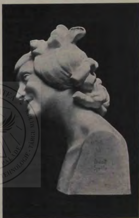
Oscar Späthe: Bacantă (marmură).

Un alt izvor de îmbogățire pentru limba literară îl găsim în împrumuturile din limbi străine, fie din limbile moarte, fie din limbile moderne. Aceste cuvinte nouă, neologisme, se impun limbii noastre literare numai atunci, când pe pământul românesc nu se găsește acel lucru, a cărui numire pătrunde acum în limbă, ori vieții noastre intelectuale îi lipsește ideea, pe care o împrumutăm acum din experiența veche ori nouă a altui popor. Astorfel de cuvinte noi le dăm (cu foarte puține excepțiuni) o formă românească d. e. linșați, trusturi, și