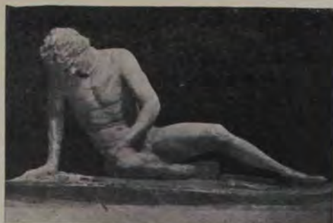
Capitolul: Galul murind («Gladiatorul»).

Aici e o altă lume încântătoare de marmore și bronzuri. La mijlocul unei săli mari e prea cunoscutul grup de bronz: Lupoaiica dela care sug cei doi gemeni Romulus și Remus