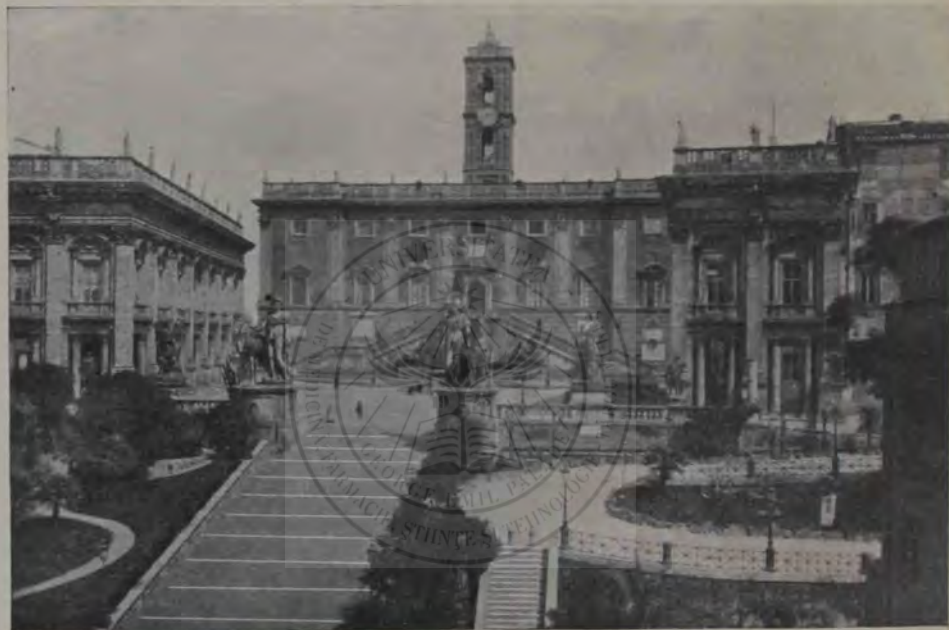
Capitolul de astăzi.

O Amazoană rănită, cu brațul drept răzimat odinioară de o lance, ne atrage cu deosebire privirea în aceeaș sală: e o copie după născocirea fericită a lui Cresilas, un mare artist din vremea lui Fidias. Expresia durerii ce o vedem pe fața înclinată a voinicei femei mărește interesul lu-