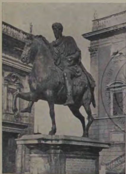
Capitolul: Statua lui Marc Aurel.

(aceștia sunt un adaos din veacul al 16-lea). E o lucrare vrednică de cinstea și mirarea noastră prin vârsta ei de aproape douăzeci și patru de veacuri. Deși deplin romană în înțeles, ea totuș se socotește ca unul din cele mai bune exemplare de artă ioniană de pe la sfârșitul sec. al 6-lea a. Hr. Stilul țapăn arhaic cu linii exagerate, convenționale în parte, nu numai nu-i micșorează viața, ci dau — mai cu seamă capului de fiară — un relief și o energie, care explică fiorul de neliniște ce-l simțim la întâia noastră aruncătură de ochiu.