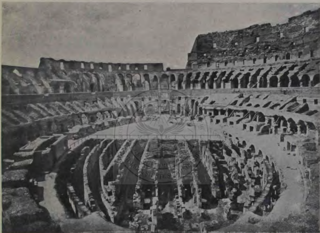
Coloseul văzut din latura sudost. (Starea actuală). Jumătate din arena din față e descoperită pentru a se vedea substrucțiunile ei.

Două treimi din el însă până atunci au căzut pradă oamenilor și vremii: din marmura și stucul strălucitor, cu care îi erau îmbrăcate cărămida și tuful zidurilor din năuntru, n'au mai rămas decât resturi neînsemnate; însăș fața lui de