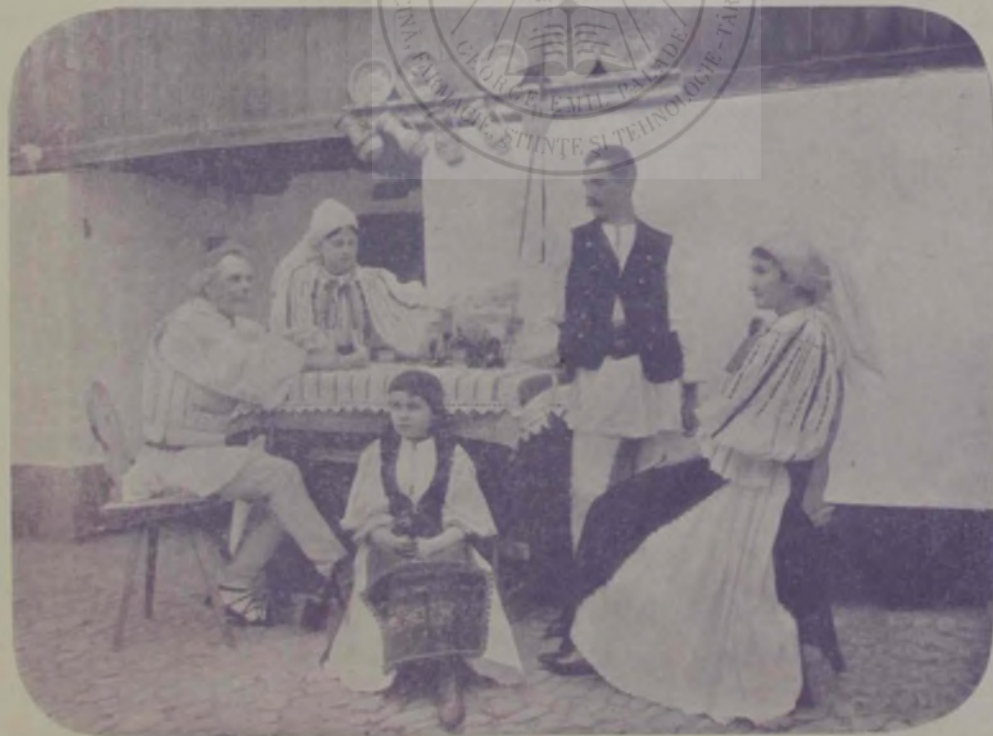
Tărani din Tilișca. (com. Sibiu).

„Da, — răspunse, — l-am văzut și am vorbit cu el, dar asta nu e nimic!“