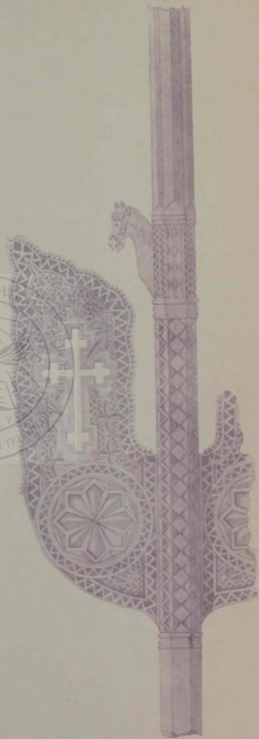
Încrêștături pe furci de tors din comuna Tilișca. (Colecția dlui Comșa din Sibiu.)

Cu cită dragoste pusese el hirtia aceea de o sută în fundul lăzii! Se gîndia atunci: baia-tul n'o să-mi măi ceară banii și cu hirtia asta mă duc și eu să văd orașul acela mare și să mă bucur și eu, după atîtea ostenele, de izbînda ficioru-meu. Să tragă și el un chef, cind și-a vedea ficiorul domn gata. De-o vreme încoace