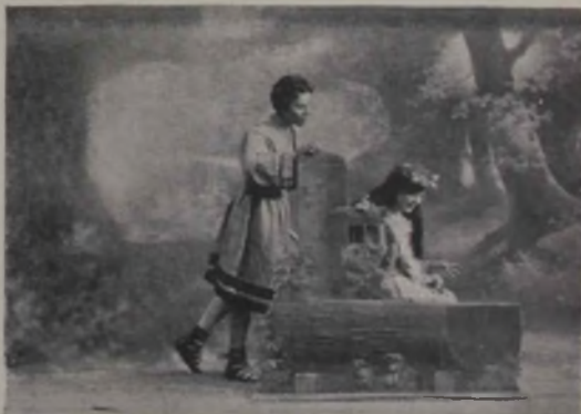
Scene din „Fintina Blanduziei.“