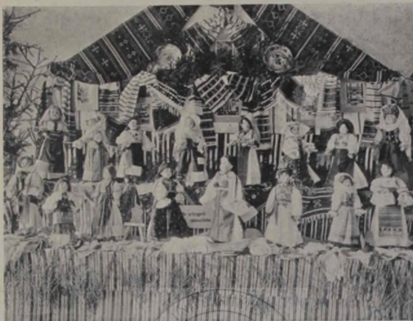
„Păpușe.” (Expoziția dela Sibiiu.)

Concursul. Un punct urmărit cu viú interes în lanțul acestor lungi și obositoare festivități a fost concursul fixat de bunăvoînța comitetului societății de teatru, pentru împărțirea celor două burse create din acest prilej. Asistența număr-oasă a unui public de toate păturile a fost o nouă dovadă cit de mult simte lumea noastră nevoia unui teatru românesc, care n'ar fi ocrotit numai de însuflețirea puțin iscusită a diletanților. Întimplarea însă și stingăcia, nu tocmai întimplătoare, a celor meniți să poarte cirna și soarta acestui fond înjghebat din sărăcia obștei noastre — au făcut din acest punct al „planului de acțiune” un prilej de jale și haz, provocind și o tulburare furtunoasă de păreri . . .