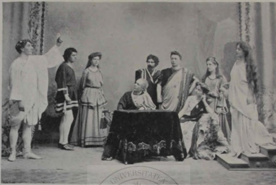
Scenă din „Flintina Blanduziei”

destul de mulțumit și împăcat cu soarta ce-i este dată.