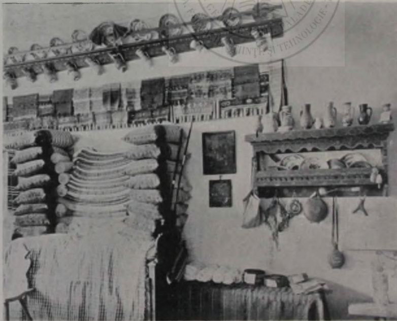
„Odale țărănească.“ (Expoziția dela Sibiu.)

că era mai mult o cantonerie. Lume multă nu se aduna, în jur era pustiu, lanuri de cucuruz și departe undeva Mureșul. Dar Mureșul e mut, și nici o ață de vînt nu mișca frunzele de cucuruz. Mă plimb eū așa o bună vreme, dar nu mă puteam gîndi de loc. Îmi vuia capul și lumina albă a lunii îmi făcea rău. Dar iată că s'aproapie o clacă întreagă de feciori și de fete. Chiuiău în urma ceterașului, cîntău cîntecule lungi de dragoste, cum lungi vor fi cei trei ani de despărtire. În fața gării se opriră, traseră