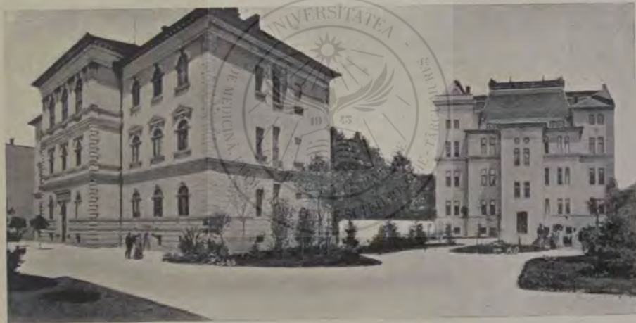
Școala de fete.

am nimerit într'un sat chiar bine. Așa noroc rar mi s'a mai dat. Regiuni frumoase, păduri, știi păduri de să te pierzi prin ele, și o matcă de apă, un șivoiū de munte rece ca și cristalul. Oamenii din sat cinstiți, înalți și frumoși, ca niște brazi. Și era un cer senin și înalt, cum nu se vede pe alocuri. Iar cînd veniau furtuni, gîndia că aici e la capătul lumii. Notaru mă primește bine, știi un român cinstit. Ne invoim noi cu prețul. „Bani atît.“ Bun zic eu. „Locuință și mîncare la mine.“ Și mai bun. Așa, mă gîndiam, mai înțeleg și eu să trăești în lumea asta. Și mă apuc eu de scris și mă pun eu pe lucru, știi să-mi arăt hărnicia toată. Și dlui, om de cinste, vine și mă bate pe umăr: „Brav tînăr.“ Și muncesc eu așa toamna întreagă, pînă aproape de Crăciun. Cînd eram liber, făceam niște plimbări ca acelea de-mi venia să cînt tot drumul. Citeodată mergeam la pescuit, știi păstravi de