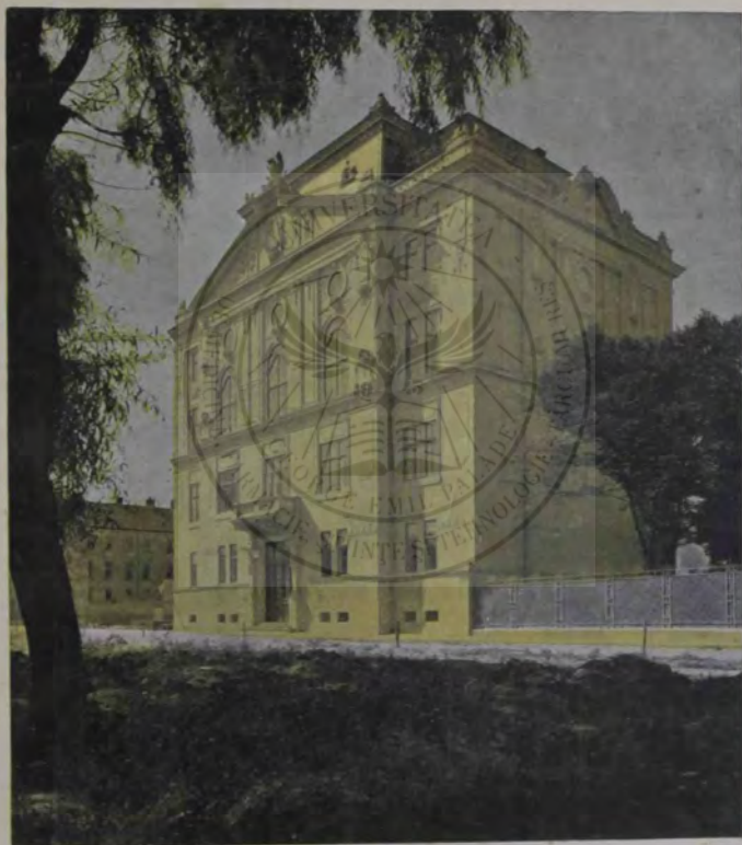
„MUZEUL NAȚIONAL” DIN SIBIU.

ANUL IV. — BUDAPEȘTA, 1 SEPTEMBRE, 1905 v. — NRUL 17.