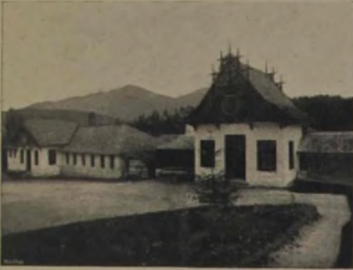
Scaldele reci și calde.

virful dealului, de unde și se desfășură o pinză lată de frumseți neperitoare, stă din vremuri bătrâne un chiosc singuratec.