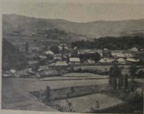
Scalderle și jurul lor.

Întrînd pe terenul băilor, un deal de formă conică îți atrage numai decît luarea aminte. Din sînul acestui deal, cam la jumătatea înălțimii lui, își iaū obîrșia izvoarele principale. În