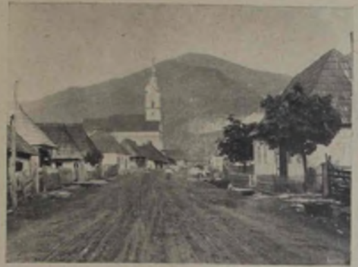
Strada principală și Biserica.

să fie capabil a simți mai adinc decât de obicei, a-și asocia idei de abstracțiuni, trebuie să-l pregătești cu mijloace artistice extraordinare.