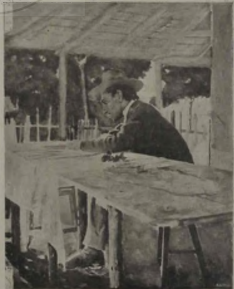
Pictorul de el însuși.